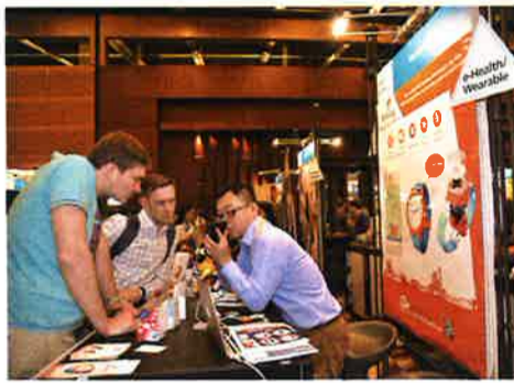
「エレクトロニック・アジア」で熱心に商品説明する展示スタッフ

■第22回「エレクトロニック・アジア」 広東省深圳市が「中国のシリコンバレー」として急成長を遂げる中、香港が中国エレクトロニクス産業の海外に向けたショーウィンドーとして果たす役割も年々重要度を増している。本フェアは同時開催される部品展示会「エレクトロニック・アジア」と合わせ、出展者数が4280社(17年実績)、来場バイヤー数が延べ8万6043人(同)にも上り、「本気の商談」の場として、日本の業界関係者が多数訪れる場としても知られる。