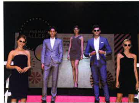
「オプティカル・フェア」ではモデルによるショーも開催