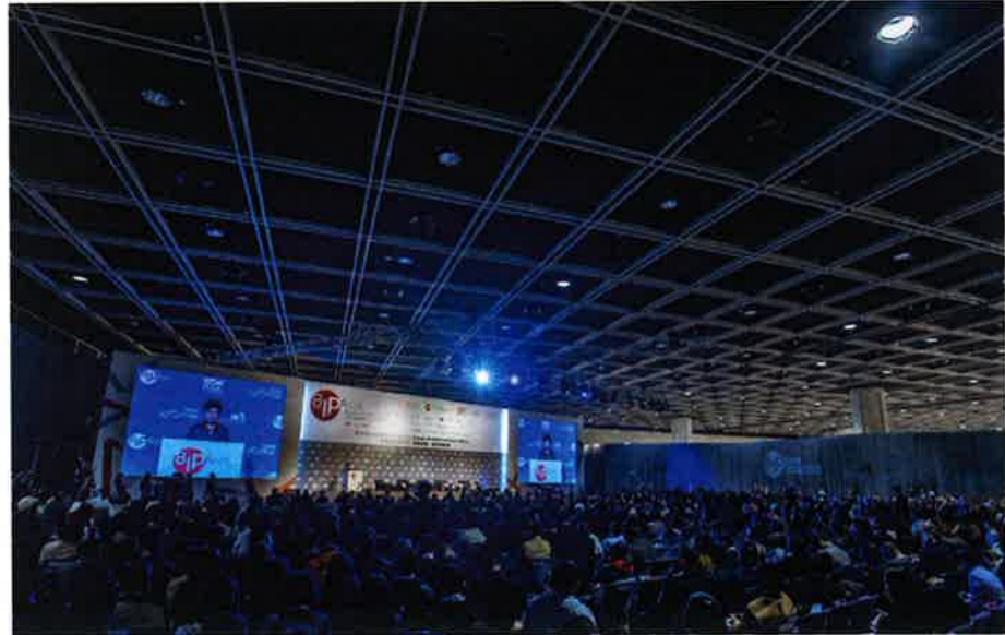
「知財フォーラム」であいさつする香港の林鄭月娥 (キヤリ) ラム 行政長官

米中貿易戦争の発端にもなった知的財産権 (IP) の侵害問題。こうした知財にかかわる問題を取り扱う国際会議として、これまでに7回開催されてきた。昨年は「知財とイノベーション：革新、成長、連繋の促進」と題し、各国から約80人のスピーカーと2500人以上の来場者を集めた。