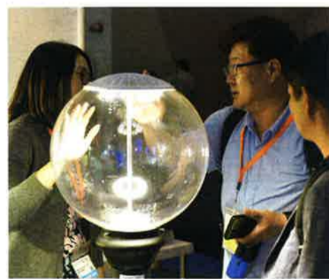
「ライティング・フェア」で品定めするバイヤーの姿