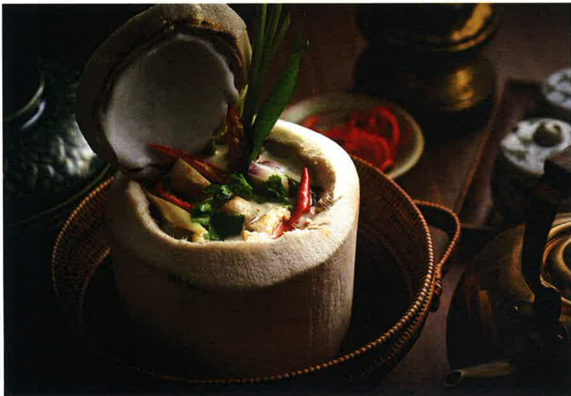
ヤングココナッツに入れて提供され、甘辛酸の味わいが一体になったクリーミーなチキンスープ「Tom ka gai」(108ドル)