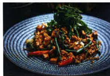
豆腐のタイバジルいため「Phad bai ka pow」はハーブ香がさわやか