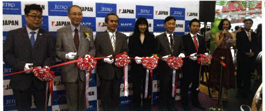
「ワイン・フェア」には例年、日本貿易振興機構(JETRO)がパビリオンを設

中国本土や香港での住宅・商業施設の建設需要が旺盛な中、建築物に不可欠な照明関連製品にも膨大な需要が存在する。照明業界の専門展示会としては世界最大規模の本フェアには昨年、2670社が出展。展示スペースの限界から、3年前にスピナウトして「アジア・ワールド・エキスポ」で同時期に開催される屋外照明の展示会にも昨年、410社が出展した。両展示会場を訪れた来場バイヤー数は昨年、延べ5万4922人を数えた。日本の建築業界からも大きな注目を集めており、日本から訪れるバ