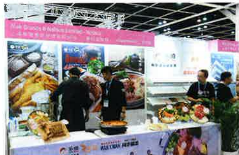
韓国ノルブのブースではキムチを使った鍋料理の実食も