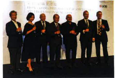
プロオーケストラ創設45周年を祝うヤープ・ヴァン・ズヴェーデン、張建宗(マシニュー・チャンネル政務長官)

ヤープは音楽監督就任以来マーラーの交響曲を毎シーズンとりあげているが、今シーズン演奏されるのは第2番(19年5月17、18日)、7番(今年11月16、17日)、9番(19年4月26、27日)といずれも大曲ぞろい。さらに第7番と第9番については、全席自由席で200ドルで提供されるという今回初の試みだが、これはまさにヤープのマーラー演奏に対する自信の表れともいえる。