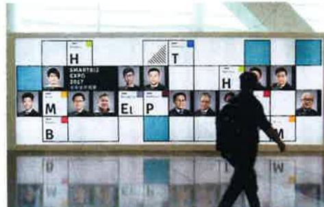
スタイリッシュな看板が目を引く「スマートビズ・エキスポ」