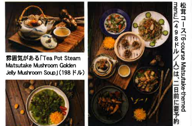
雰囲気がある「Tea Pot Steam Matsutake Mushroom Golden Jelly Mushroom Soup」(198ドル)

またCNNトラベルの「香港のベスト・ベジタリアン点心」に選ばれた同店の飲茶メニューの中では、ケールの苦味が効いている Kale & Porcini Mushroom Griddlecake (78ドル)がおすすめ。ベジタリアンの人もそうでない人も楽しめる、舌にも目にも楽しい料理と、落ち着いたインテリア。パーティーや記念日にも最適なので問い合わせてみて。(取材協力・Jin Communications /文・綾部智美)