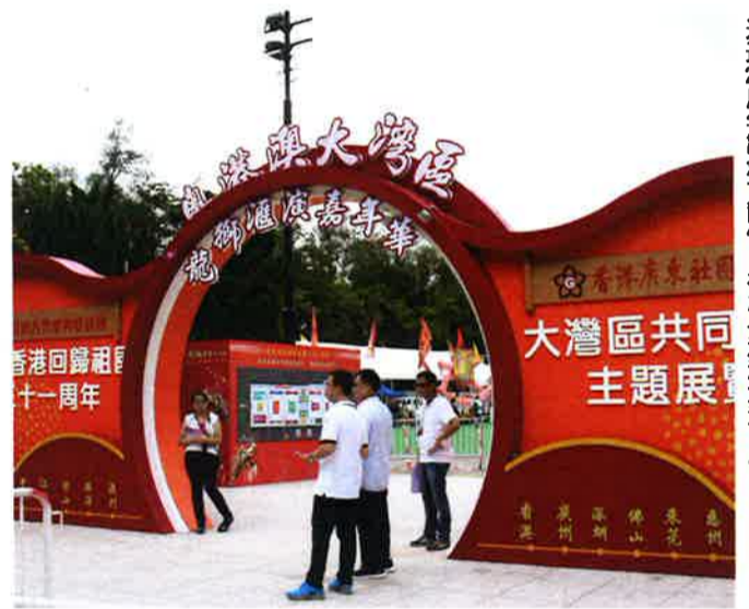
返還21周年記念で開催された粵港澳大湾区のイベント

港珠澳大橋に接続を求めた深圳が、香港の反対でこれを断念させられたのが典型例です。最近中国の「国策」に位置づけられる「粵港澳大湾区」は、珠江デルタと香港・マカオの一体化を進めるもので、「一見すると「中港融合」の延長線上にあるように見えます。しかし、今回は本土の国家計画の用語の「錯位発展」という言葉が使われていることが一つの特徴でしょう。ここで