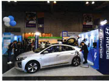
「エコ・エキスポ」に並ぶ韓国・現代自動車のハイブリッドカー

マカオと並び世界で最も人口密度の高い都市のひとつである香港は、大気汚染やごみ処理などの都市問題に直面している。環境改善は重要な課題だ。こうした背景から本エキスポにはカナダ、韓国、日本、ドイツなどといった環境先進国の企業が多数出展し、香港や中国本土のバイヤー向けに先進的なエコ製品を売り込む場として活用している。