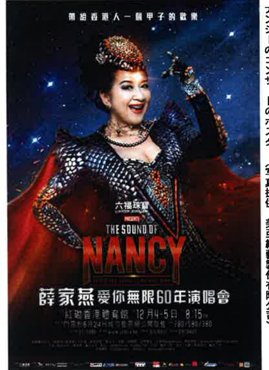
ナンシーのコンサートのポスター

そんな彼女の「家燕媽媽(ガーン・ママ)」キャラは、教育界にも進出。絵本の出版から始まり、彼女自身が司会を