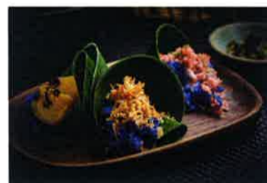
ココナッツやマンゴーフルーツのエキゾチックなデザートも豊富に用意