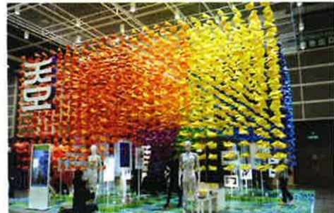
鮮やかなインスタレーションが強いインパクトを与える