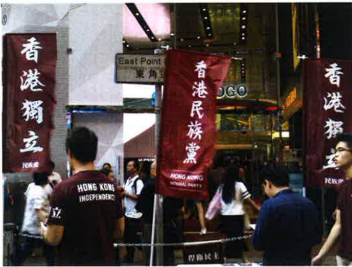
今後は香港民族党のメンバーを名乗る者は違法とみなされる