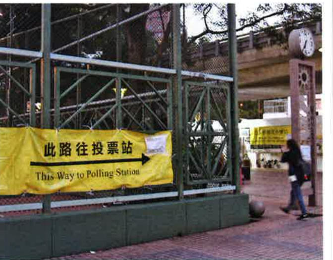
歴史的な結果となった3月の立法会補選の投票所