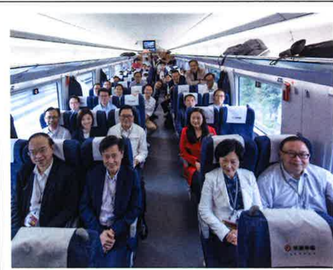
粵港澳大湾区を視察し高速鉄道に乗車した議員ら