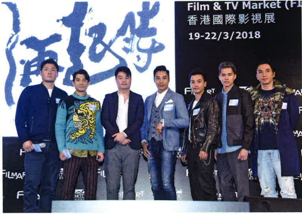
フィルムマートに参加した香港の俳優たち

グラム構成となった。分科会では来賓挨拶として熊本県知事の蒲島郁夫氏とくまモンが登場し、同日にライセンシングショー内で開催された海外記者向けのくまモンの記者発表会のもようも合わせて報告された。