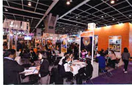
どの出展者ブースでも熱心な商談が繰り広げられた

会期中は香港・中国本土を中心に映画会社やテレビ局などが会場内で新作発表会等を行って