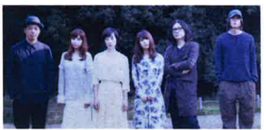
「ヘクとパスカル」のメンバー

【日時】5月19日(土) 20:00 開演 【会場】MUSIC ZONE@EMAX(九龍灣展貿徑1号) 【料金】780ドル 【ネット予約】購票通 CITYLINE ( http://www.cityline.com ) 【香港公演主催者サイト】 www.forwardmusic.com.hk 【岩井俊二公式サイト】 http://iwaiff.com/