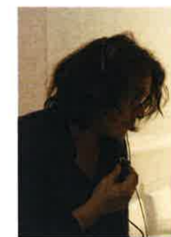
映画監督で音楽家の岩井俊二 詳細は右記サイトなどを参照のこと。

「ヘクとパスカル」は一昨年7月、中国5公演(北京・成都・上海・西安・広州)で延べ4600人の観客を動員するなど大成功を収めた。今回の「アジアツアー2018」では香港、台湾、深圳、上海、東京、大阪のアジア6都市でコンサートが開催される。本公演は「音楽家・岩井俊二」を間近で堪能できる貴重なチャンスだ。