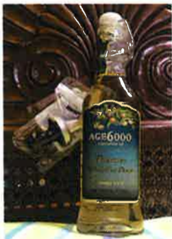
100%冷壓初搾野生山茶油(通常価格 1本145ドル 編集部調べ)

食べてよし! 塗ってよし! スゴイぞ「100% 冷壓初搾野生山茶油」。 (このコーナーは月1回掲載)