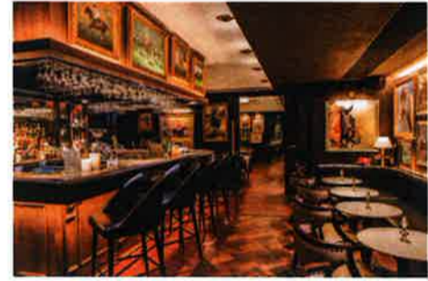
7種のステーキメニューは6つの焼き加減から(上)。重厚な真鍮のバーカウンターに目を奪われる(下)