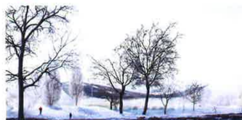
ハンガリーの音楽博物館のパー