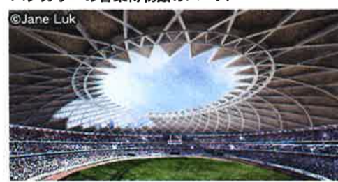
東京スタジアムの設計コンペにも参加した