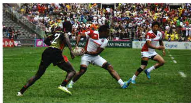
日本代表は大会を通して随所に日本らしい攻撃力を見せた

コアチーム予選大会の決勝の相手はドイツ。前半1分すぎにトライを決めるも、前半3分、前半終了のホイッスルが鳴った最後のプレーで連続トライを奪われる。しかし、日本は後半1分過ぎにすぐトライを奪い返し、12対14に迫る。アディショナルタイ