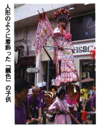
人形のように着飾った「飄色」の子供

筆者・和仁康夫(わに・ゆきお) 1956年東京生まれ。香港で第2次大戦期の日本占領史跡などを扱った『歲月無聲』(花千樹出版・中文)を出版。中国ミスコンに関しては、「広州『姿』本主義〜香港返還もう一つの意味」(霞山会『東亞』2009年9月号)がある。