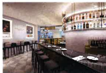
開店間もないパシフィック・ブレイズ店は、高級ジュエラーの並ぶ3Fに立地