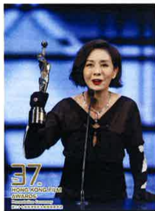
主演女優賞受賞のテレサ・モウ