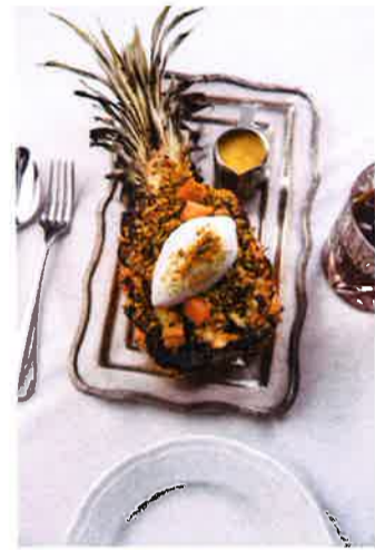
焼きパイナップル、ココナツケーキ、ラム酒のシャーベット