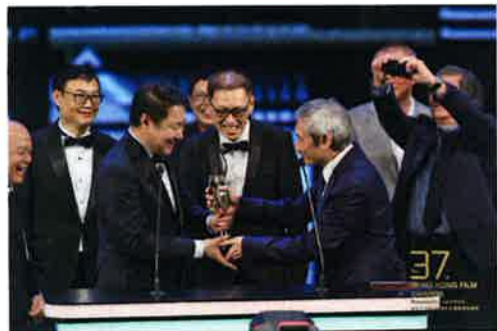
作品賞受賞に喜ぶ『明月幾時有』の製作スタッフら(上)

第37回香港電金像獎の授賞式が4月15日、香港カルチュラルセンターで開催された。「香港のアカデミー賞」と称される同賞は、最近1年間に公開され、最も優れていると評価された映画および監督、俳優などに与えられる。今年も主要タイトルである作品賞や主演男優賞など計19部門から最優秀賞が選ばれた。