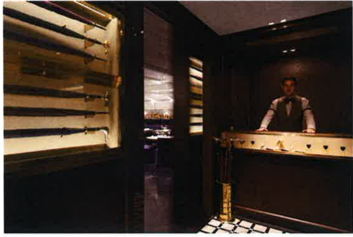
傘もインテリアとして美しく飾られたエントランス。こちらも見栄だ