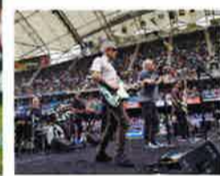
ライブバンドの演奏も