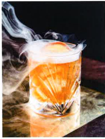
▲ウイスキー、コニャック、シガーを使ったオリジナルカクテル「Mi Gran Cigarro」(188ドル) ▲上質な油彩画や馬術の品々を華やかに美しく飾り、壮大な時代背景や貴重な文化を今に伝える