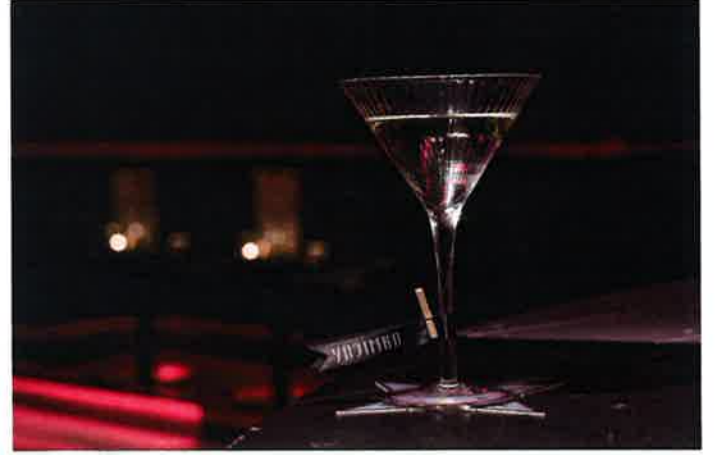
Ninija Shadow (130ドル)カクテルメニューのメッセージも見逃さずに