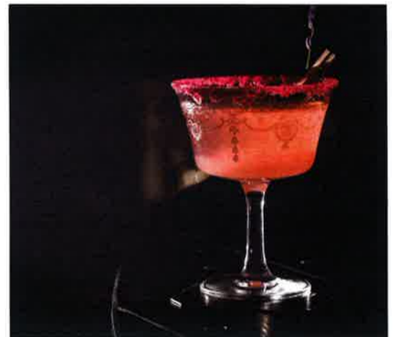
Kawaiをイメージした「Harajuku Girl」はシャンパーニュベース

所在地：Shop 2-7, UG/F, Car Po Commercial Building, 37 Pottinger Street, Central 電話：2576-1717 営業時間：火・水曜18:00～翌3:00 (木～土曜は翌5:00まで) 日・月曜休業