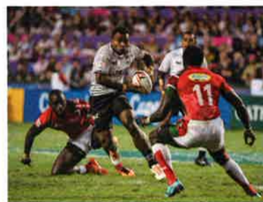
ケニアを寄せ付けなかったフィジーの選手

7人制ラグビーの祭典「香港セブンズ」が4月6~8日、香港スタジアムで開催された。メインの「カップ戦」はフィジーが4連覇を果たし、日本代表はコアチーム昇格決定大会で見事優勝した。(取材と文:郷原章)