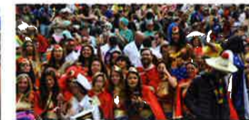
セブンズといえばコスプレ

ムの日本の最後のプレーは、粘りに粘って途中出場のリサラが「さよならトライ」を右隅にして劇的な形で優勝を果たした。