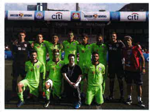
2017年大会に続き今年も参戦するイタリア・セリエAのカリアリ・カルチョ