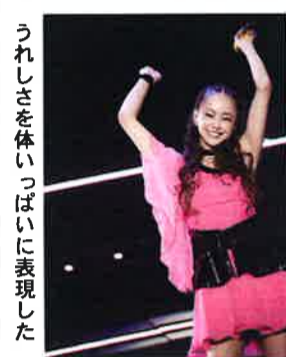
うれしさを体いっぱい表現した

オープニングはリオデジャネイロ五輪でテレビ局のテーマソングとなり大ヒットした『Hero』から始まった。前半の中で『Love Story』は観客が携帯電話のライトをペンライト代わりにして左右に振り、会場全体が幻想的な雰囲気となった。