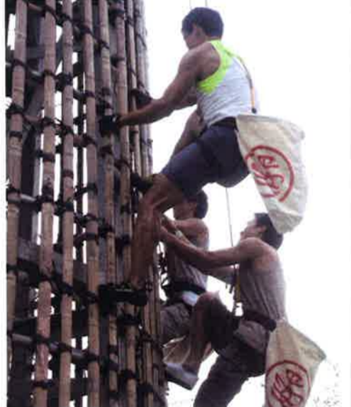
まんじゅうレースの予選の様子。塔に上りながら背負った袋にまんじゅうを入れ、一番を多く取った者が勝利を収める

「まんじゅう祭」と呼ばれるゆえには、奉納されたまんじゅうが人々に配られることからだが、まんじゅうをくくり付けた高い塔によじり上り、取ったまんじゅうの数を競う「まんじゅうレース」にも起因している。塔の上でまんじゅうを取り合うと聞くと、田舎の素朴な催しを想像するかもしれないが、まんじゅう祭の選手にはかなりのスピードと瞬発力が要求される。 実はこのレース、1978年に塔が倒れ、24人がけがをする事故が起きてから、長中中止されていたが、再開を望む市民の声があまりに強いため、新たなルールを設けて2005年に復活した。 また、昔からレースには本物のまんじゅうが使われ、レース後は観客にこのまんじゅうが縁起物として配られていたが、衛生上の問題から現在はまんじゅうを模した柔らかなプラスチック製の物が代用されている。 まんじゅう祭は2011年に中国国家文化部の承認を受け、「粵劇(広東オペラ)」「涼茶(漢方茶)」「大澳端午遊涌(ドラゴンボート水上パレード)」「大坑中秋舞火龍(ファイヤーダンス)」の4つがユネスコの世界無形文化遺産に登録された。イベントの詳細はセントラルフェリーの掲示板などでも案内される。(この連載は月1回掲載)