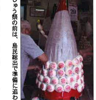
まんじゅう祭の前は、島民総出で準備に追われる