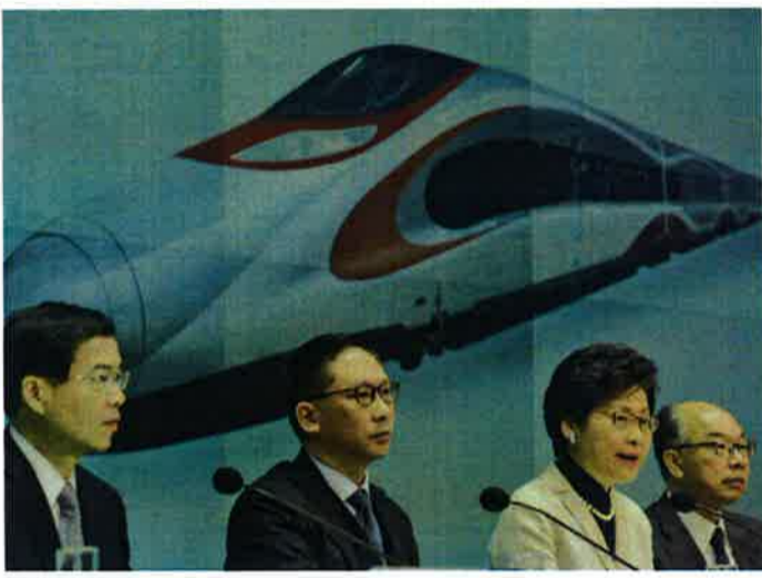
全人代常務委での可決後に記者会見した特区政府高官

全国人民代表大会(全人代) 国会に相当) 常務委員会は昨年12月27日、「広深港高速鉄道(広州-香港間高速鉄道)西九龍駅に設置する税関・出入管理所での「一地両検」実施に関する中国本土と香港特区の協力措置を承認する決定」を可決した。今年第3四半期の高速鉄道開通に向けて特区政府は最終段階として2月に立法会に「一地両検」草案を提出するが、非親政府派は依然として実現を阻止する構えだ。