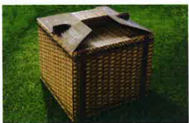
おしゃれなボックスで配達される

寒い季節の定番料理といえば火鍋。火鍋専門店の味を自宅でも再現できたら…。そう思う人は多いだろう。そんな人にぴったりのサービスがこれ。「ニューエイジ」をコンセプトとした斬新なアイデア