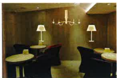
明るい清潔感のある内装、席数も多く街歩きに合間に一息つくのに最適な空間。