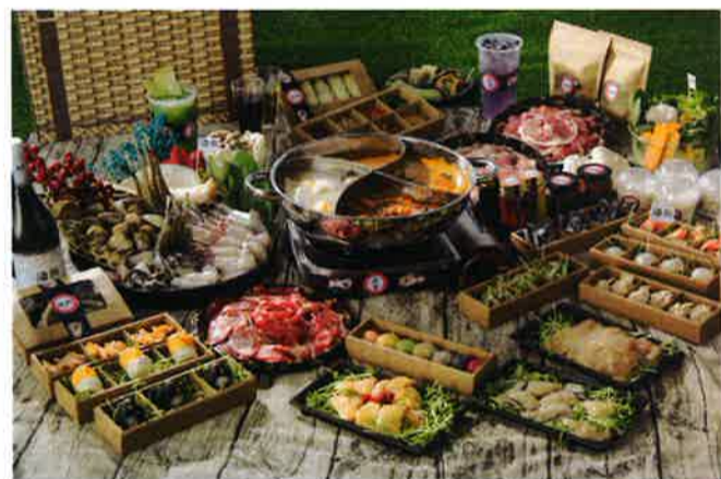
鍋を囲んで仲間とわいわい楽しみたい