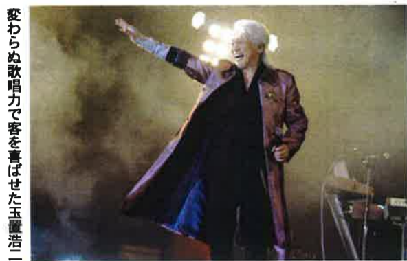
変わらぬ歌唱力で客を喜ばせた玉置浩二