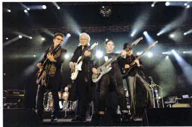
メンバーそろってのギタープレー

ブレイクさせたヒット曲『ワインレッドの心』から。香港でも謡詠(アラン・タム)がカバーして香港人なら誰でも知っている曲だ。14曲目の『夢のつづき』は張学友(ジャッキー・チェン)が『月半湾』というタイトルでヒットを飛ばしたが、玉置浩二は広東語で『月半湾』(歌詞にもなっている)と歌い観客を喜ばせた。