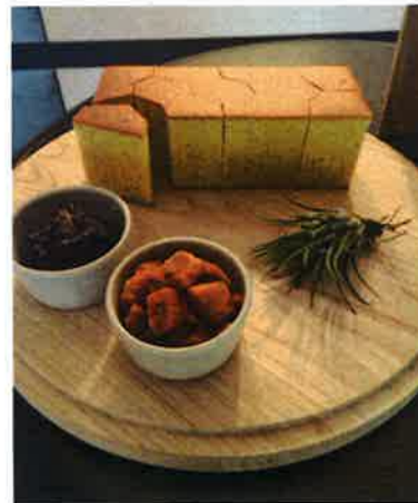
しっとりとした食感の「蜜豊糖蛋糕」は2種あり、オリジナルのタマゴ風味は300元、ブルーベリーは350元だ

台北市内には新光三越新義デパートや桃園空港内にもオープン、時間のないときはそちらを利用したい。旅に出るチャンスがない、香港に居ながら台湾銘菓を楽しみたいという人はセントラル支店などで手に入れよう。