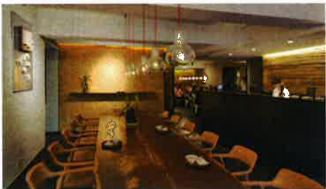
大きなテーブルの置かれた民生公園店で試食を楽しまう

ブルケーキ。餡は契約農家による地元産100%のパイナップルを使用、ほとんど砂糖を用いず、果肉本来の自然で上品な甘さと酸味を醸す。生地には上質な地元産卵、日本産小麦粉を使用する。パイナップル畑が一面に広がる台湾南部の南投丘陵の地に、2009年に1号店がオープン。翌年には多くのお客の要望で台北に2号店を開店させた。