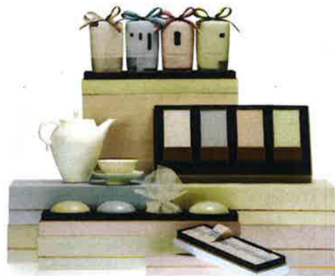
▲「春雨」「描香」「若水」「欲言」と名付けた台湾四大銘茶

併設するレストランやカフェスペースでは、新しい食の楽しみとして、ティーペアリングを提供。茶の香りやフレイバーと西洋料理との相性をぜひ楽しんでほしい。