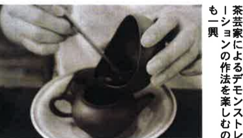
店内には長年丁寧に磨かれた家具を品よく配置