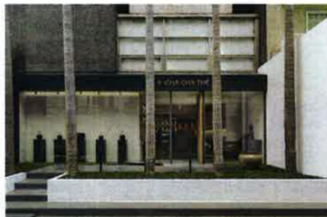
まるでブティックのようなガラスばりのおしゃれなエントランス。伝統茶器や茶具がモダンな店内インテリアの中でセンスよく調和する

お勧めしたいのは台湾四大銘茶といわれる「梨山烏龍」「阿里山烏龍」「文山包種」「東方美人」。