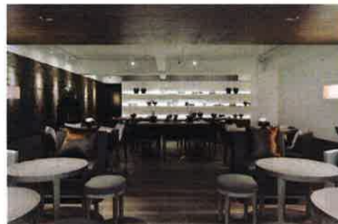
グレイッシュベージュを基調とした落ち着いた優雅なサロン。プアル茶葉から作った壁のブロックからティーフレイバーが香る

人」。このほか、世界で最も需要ある紅茶においてはまだそれほど知られていない四大台湾紅茶の「台東紅烏龍」「魚池阿薩姆紅茶(台茶8號)」「日月潭紅玉(台茶18號)」「三峽蜜香紅茶」を用意するなど、茶文化の魅力と奥深さが堪能できる。