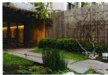
広い公園に面した一角はグリーンが美しい。客も次々と立ち寄る。

民生公園店 所在地: No. 1, Alley 4, Lane 36, Sec. 5, Minsheng East Road, Songshan District, Taipei City 電話: +866-2-2760-0508 営業時間: 10:00 ~ 20:00 新光三越新義店 電話: +866-2-2723-3858 営業時間: 11:00 ~ 21:00 (休日は~ 22:00) 桃園機場2樓第2店 営業時間: 7:00 ~ 20:00