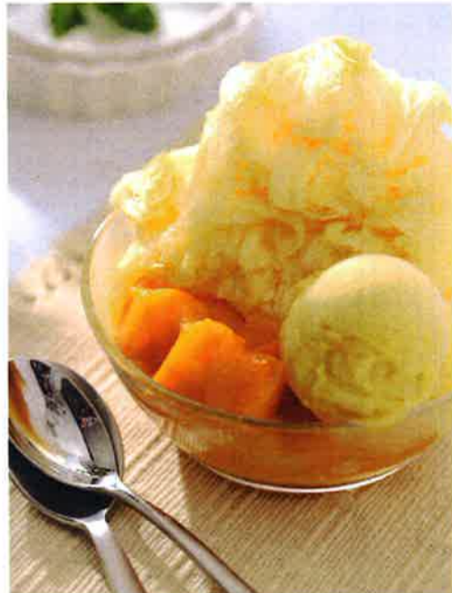
まずはオーダーしたい人気メニューの「マンゴーかき氷」(250元)。濃厚なマンゴーシャーベットと果肉、マンゴーシロップがたっぷりだ

いずれも新鮮で上質な材料を使用。超人気店となった現在においても、創業当時の真摯な店づくりはそのままに、常に驚きや新鮮さを発信して目が離せない。夜遅くまで営業しており、夕食の後のデザートにもぴったり。テークアウトもできるので、ホテルでゆっくりと味わうのも良案だ。