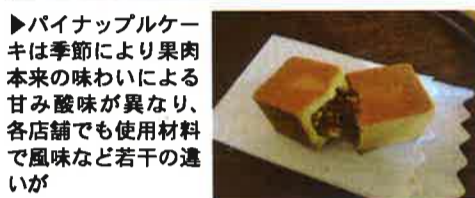
▶パイナップルケーキは季節により果肉本来の味わいによる甘み酸味が異なり、各店舗でも使用材料で風味など若干の違いが

ナチュラルな木調のカフェ風店内では、来店のお客ひとりひとりに試食用のケーキとお茶を丁寧にサービスしている。テークアウトのみのメニューは通常は3種で、定番「鳳梨酥」とカステラ風の「蜜豊糖蛋糕」、パイナップルジュースの「鳳梨汁」。ジュースは茶やビール、ほかのフルーツとブレンドしたり、ショウガと一緒に温めて味わうのもお勧めだ。包装紙代わりの麻の手提げ袋も愛らしい。