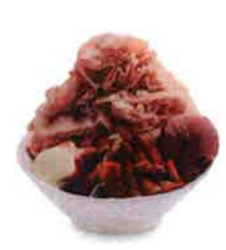
「イチゴかき氷」(260元)もファンが多い。イチゴシャーベットと果肉、パンナコッタが入っている