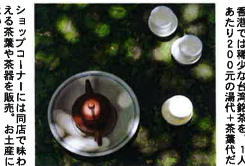
香港では稀少な台湾銘茶を、1人あたり2000元の湯代+茶葉代だ

街の喧噪を離れて旧市街まで足を運び、ゆっくりと流れる時間の中で、貴重な茶文化にふれてみてはいかがだろう。