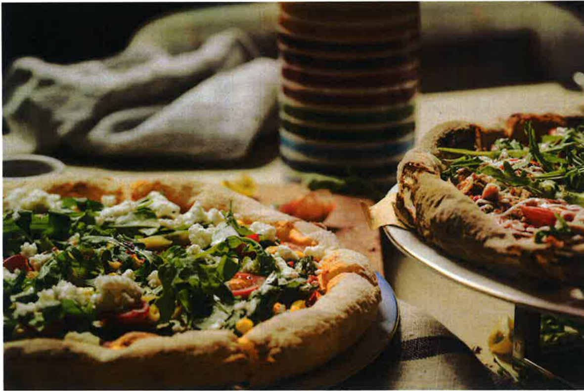
香ばしく焼かれた人気のピザはさっくり&もっちり。野菜たっぷりの「Primavera」とツナのトッピング「Tonno」(170ドル)。ルッコラがアクセントに