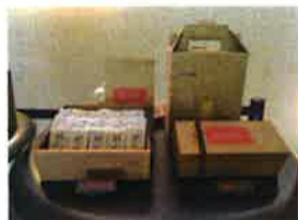
◀ナチュラル&おしゃれなボックス入り「鳳梨酥」(10個入り450元、16個入り670元)