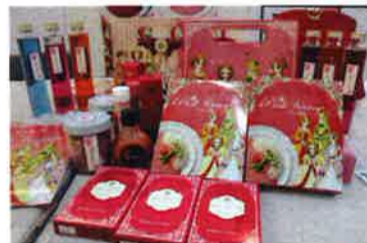
「ピンク華麗」などの商品

カレーは容量200グラムのレトルトカレーで、色はまさにピンク色。味はカレーそのもので、辛さは1種類のみでさほど辛くないので安心して食べられる。ほかにも「ピンク華麗うどん」(カレーと乾麺の2食入り)が228ドル。また、ピンク醤油の「華貴婦人」もあり、Coron(100ミリリットル)は208ドル、Rose(50ミリリットル)は108ドルとなっている。