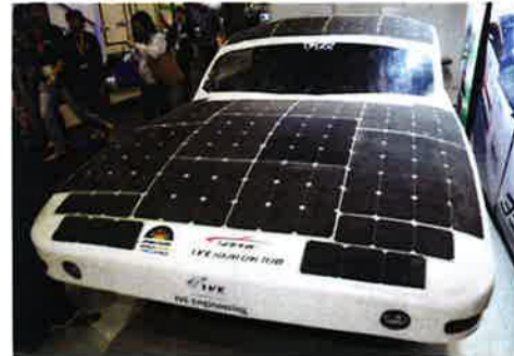
強い太陽光があれば、バッテリーを搭載せずに時速100kmでの走行が可能。バッテリーを搭載すればフルチャージで300kmの走破が可能。モーターには日本のミツバ製を採用 https://youtube/saJzxtjHeOg こちらで2015年のレースの様子が見られる