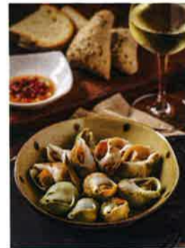
地中海風のつぶ貝の料理は酢を使った特製ソースを使う (128ドル)