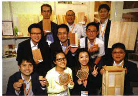
豊永林業(株)、吉野銘木製造販売(株)、奈良県農林部、奈良県産業振興総合センターの皆さん www.houei-forestry.com

ただ、この展示が「環境保護」とどのようなかかわりを持つのだろうか？ 伺った内容を要約すると、奈良の林業はすでに500年の歴史があり、植林から伐採に至るまで人の手が多く入ることで維持されており、マメに枝打ちを行うことで良質の木材となる。これらの木材は人に優しく、例えば割り箸などは間伐材の木皮（こわ）材から作られるものであり、防腐剤などの化学薬品も含まれず、建築材に使われればシックハウス対策、抗菌作用などの効果もあり、廃棄される木材はバイオマス発電に利用され、循環型の消費が完成