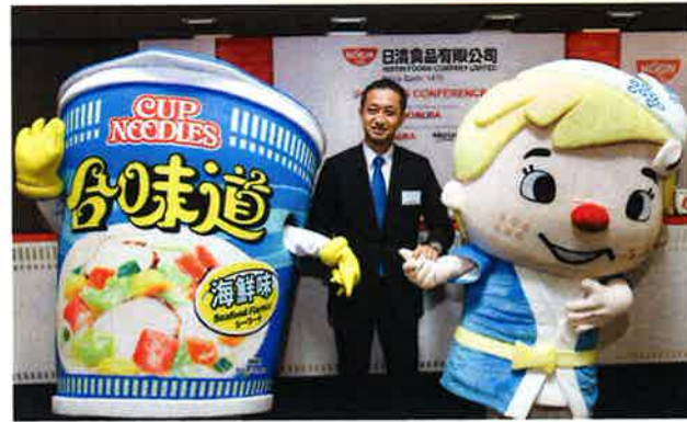
手が目立つが、珍しいところではシンガポールの飲料会社の編成の名前も見られる。今回の上場は香港を含む中国事業の分離上場。日本では日清食品ホールディングスとしてすでに東証1部に上場している。

日清食品が新規株式公開(IPO)に向け、11月29日から公募を開始することがわかった。28日付香港各紙によると、同社は1株当たり3.45～4.21ドルで2億6900万株を発行、最高で11億3100万ドルを調達する見込みだという。取引単位は1000株で、4252ドルからの投資が可能となる。公募締め切りは12月4日正午、主幹事は野村証券が務め、11日に上場する予定だ。大口投資家には伊藤忠商事や三菱商事、カゴメなど日系大手が目立つが、珍しいところではシンガポールの飲料会社の編成の名前も見られる。今回の上場は香港を含む中国事業の分離上場。日本では日清食品ホールディングスとしてすでに東証1部に上場している。