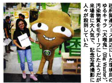
政府関連ブース周辺にいた環境局のゆるキャラ「大唯鬼」(大唯鬼)の汚染物質をモチーフにしたようだが来場者に大人気で、記念写真撮影に人々が殺到していた

他の展示ブースでも同様であったが、香港人はとても前のめりに情熱的であった。いま香港人が香港のために貢献できること…、それを環境分野に求めた人たちが集まるのがエコ・エキスポなのであろう。