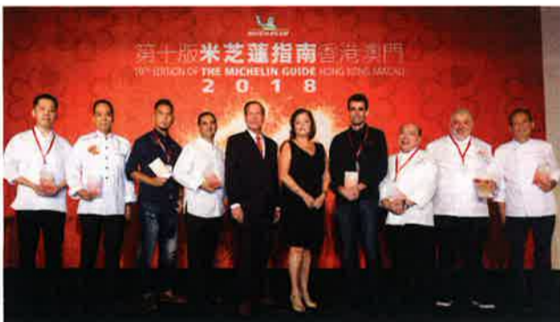
発行記者会見に出席した3つ星獲得シェフら