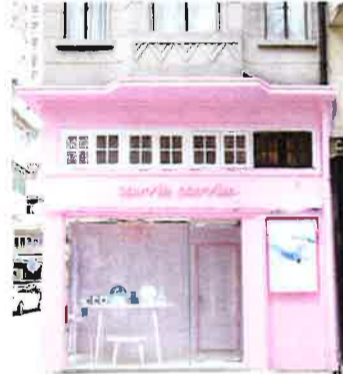
Carriewears @ carrie carries (スタジオ) 所在地: 4 Second Lane, Tai Hang, Hong Kong 電話: 2628-0005 営業時間: 11:00 ~ 19:00