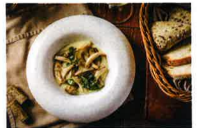
「Espaneñas」はクリーミーなソースがナマコにかかっていてまろやかな味わい (268ドル)