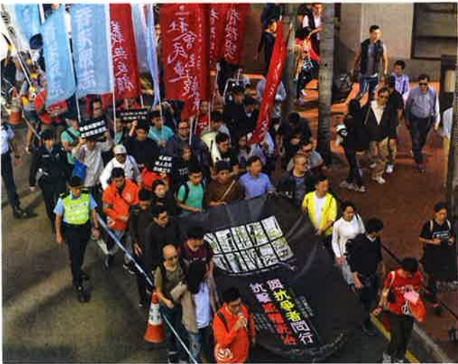
非親政府派による「威権統治に反撃しよう」デモ

全国人民代表大会(全人代) 国会に相当 常務委員会副委員長兼基本法委員 会主任の李飛氏が11月16日、香港で講演し「基本法は実施20年になるが、いま だ23条に基づく立法が実現していない」と述べた。昨今の「香港独立」言明や 国際政治の動向への警戒から、中央は香港に対して基本法23条で規定された国 家分裂や政権転覆などを防ぐ条例の制定を求めており、いよいよ立法に向き合 わねばならなくなったようだ。