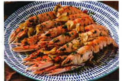
ピリ辛味だが、付け合わせレモンをかけるとさっぱりとした味になるエビ料理 (338ドル)