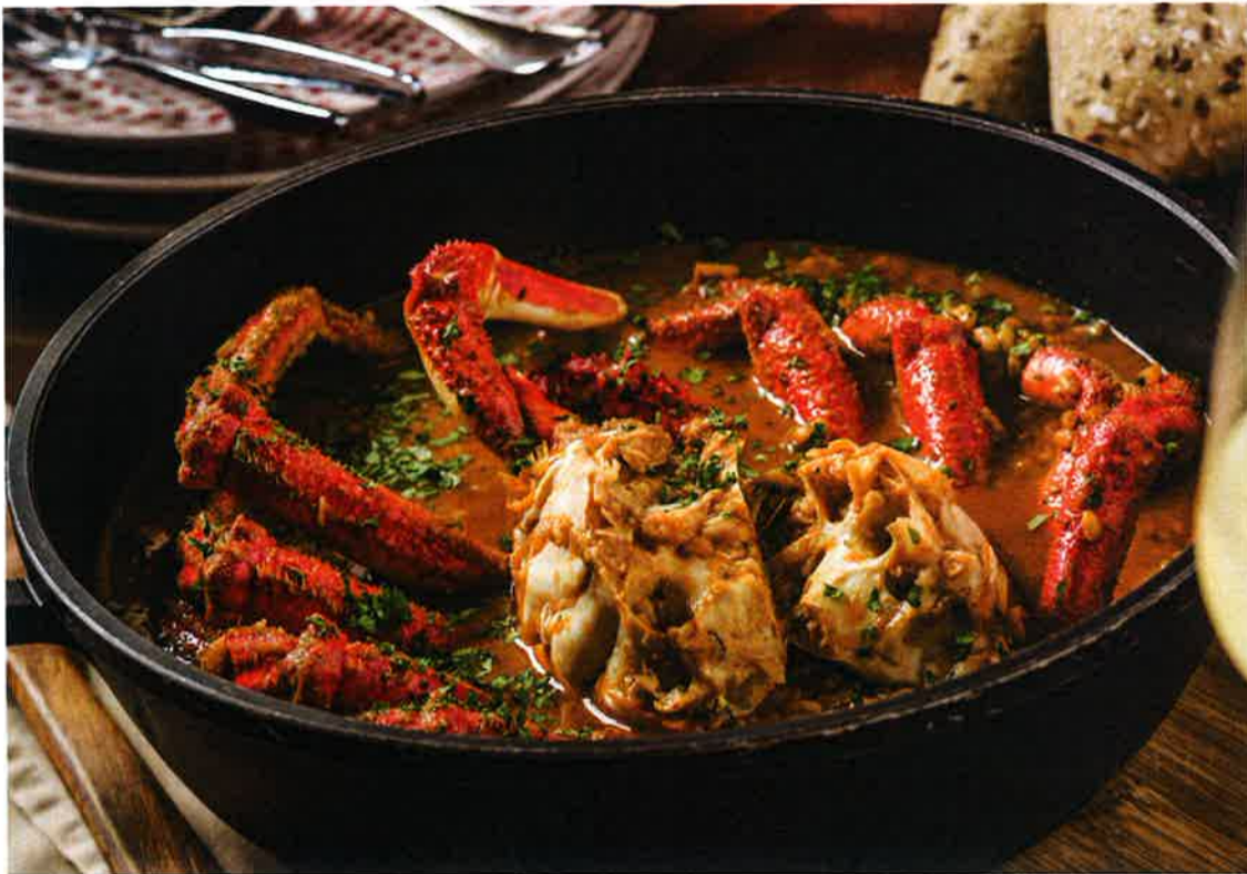
「Arroz de Centolla」はバスク地方で食べられる料理で、一言で言えばカニ雑炊のようなもの。カニももちろん食べられるほか、カニのうまみが米にしっかりと染みわたっている (388ドル)