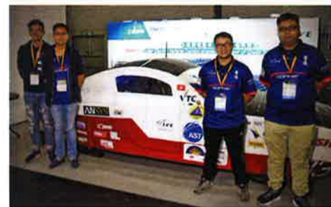
2015年のオーストラリアのレースに出場したSOPHIE V (写真の車) は完走できなかったものの、2017年のレースに出場したSOPHIE VIIは見事完走し4位の成績を取った。IVEがソーラーカーの制作に着手したのは2009年。香港製ソーラーカーは、制作開始から8年で世界の舞台に躍り出たのだ ■ IVE Solar Car www.facebook.com/sophie.ive

率直に、しつこく、ブースにいた若者に理由を聞いてみた。すると、たどたどしく振り絞るような声で、「みんな、香港に…貢献したいのです。自分の能力を使って。香港の空気は良くない。エネルギーの問題もある。自分が住んでいるところを、愛しているから、