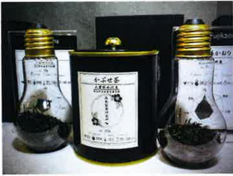
お茶は飲まないことには味がわからない。そこでパッケージにも工夫を凝らし、まずは興味を持ってもらえる「見た目」を演出しているようだ