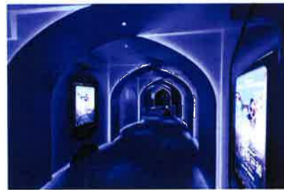
ライトアップが美しい館内

同所は今年4月に閉館した映画館「MCL JP」の跡地だ。館内には380席、280席という2つのミニシアターがあり、いずれも香港初という4K3D