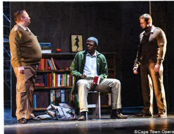
釈放直前のマンデラと看守たち