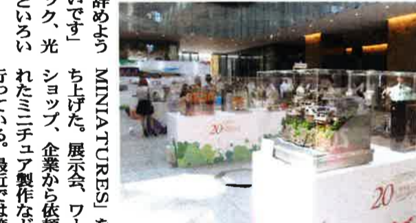
東京の展示会にも多くの参観者が