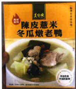
「陳皮薏米冬瓜燉老鴨」 https://www.yum.com.hk/tc/product_detail.php?id=224 で38ドル(編集部調べ)