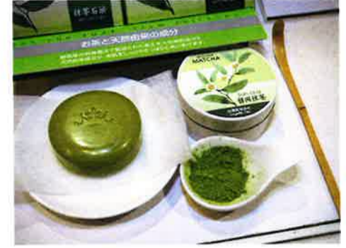
抹茶石鹸は、お茶だけではなく、コラーゲン、ヒアルロン酸、オウゴンエキス、アロエベラエキスなどの美容成分も入っており、洗い上がりがとてもしっとりするそうだ。株式会社フロムSでは他にも様々なお茶を用いた製品を開発している。詳しくは公式サイト(http://from-s.jp)参照