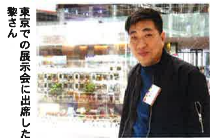
東京での展示会に出席した

建築物のミニチュアを作っていたスキルが生かされて、今は「香港の仕事人」の記憶や想像で制作している。制作期間は大きくても1週間、小さくても1日。見るからに根気がいる仕事だが投げ出しそうになったことはないのだ。大坑のファイヤードラゴン制作が難しく、壊れてしまえばもう作り直し。でも、記憶に残る思い出を残そうと思って、門とすることを会社「TOMA」が訪れ、大盛況だった。