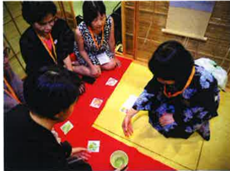
初めて日本の茶道を経験する中国人の来場者たち。1つひとつの所作を真剣に学びつつ、日本茶道への好奇心で目を輝かせていた

農林水産大臣賞を受賞したお茶を試飲させてもらったところ、一口含んだだけで、まるで極上のスープのような深い旨味が広がった。