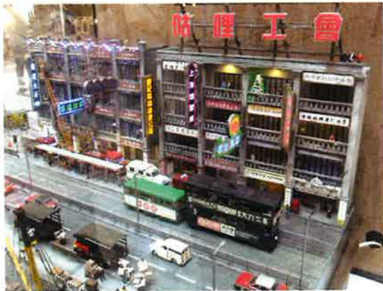
香港に詳しい人なら、街並みではなく、トラムに連結されているもう1つの小さなトラムに感動するだろう