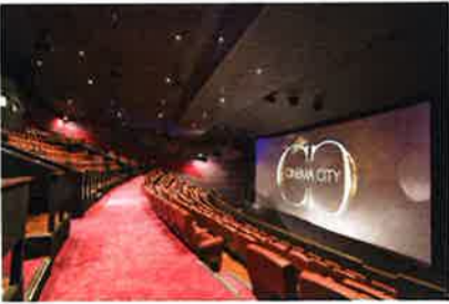
迫力のワイドスクリーン

コースウェイベいの翡翠明珠広場(ジェイド・アンド・パール・プラザ)内に映画館「CINEMA CITY JP」が10月23日にグランドオープンした。同日は映画関係者をはじめ、俳優の鄭嘉穎(ケビン・チェン)ら、迫力のワイドスクリーン