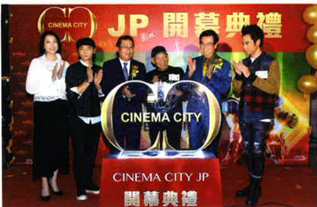
盛大に行われた開幕式典のよう