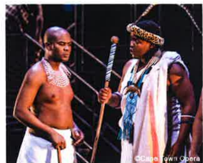
故郷の首長から歴史や寛容の精神を学ぶ若きマンデラ

南アフリカのオーケストラは、総じて英国的なスタイルを持っていますが、ケープタウンが植民地時代に英国文化の影響を強く受けたからでしょうか、このオーケストラは英国風な部分