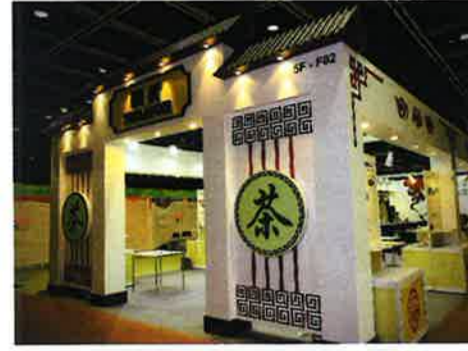
日本のブースの隣りで、とにかく目立っていた陝西省からの出展者の合同ブース

から2千年以上前の茶葉が発見され、これらは全て新芽のみで高級品であった/陝西の茶の生産は以来ずっと続いてきたものだが、ほとんどは黒茶…主に茯茶であった(訳注:茯茶は主に西域や内蒙古などで飲まれるもので、陝西省はそれらの地域に近いため茯茶が作られていたのではないかとと思われる)/近年、紅茶や高級品の生産に力を入れている/現在、陝西省で茶葉が作られている地域は高海拔で工業が未発達な場所であり、環境汚染が非常に少ない(訳注:陝西省安康市の地図をご覧ください。漢水の上流に位置し山ばかりである)。