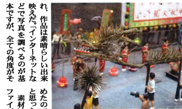
5回も作りなおしたというファイヤードラゴン。太さ0.5ミリの光ファイバー線香の先が光るようにして実物と同じ雰囲気となるようにした

香港に戻って建設のミニチュアを再び作っていた。「香港にはミニチュア協会みたいな団体があったのですが(現在は消滅)、2007年にそこにいた人から誘われたのがきっかけです」と話す。香港人は今でも歴史の建造物に関心をもち始めたが、それはここ10年くらいのこと。それまでは発展重視で古いものはどんどん壊されていった。昔の香港が好きなので、なるべく残したい。昔の香港は好きなので、なるべく残したい。昔の香港は好きなので、なるべく残したい。