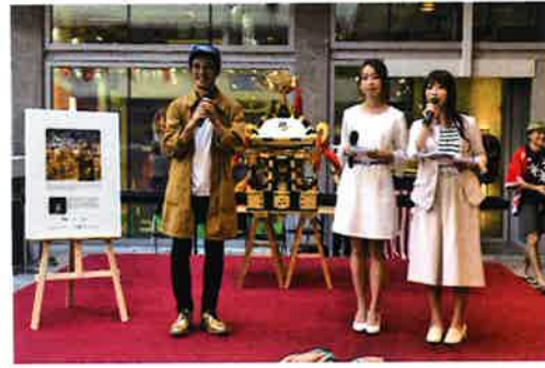
セントラルのPMQで10月18～22日、「TABLE&PARTNERS JAPAN DESIGN WEEK in Hong Kong」が開催された。19日にはスペシャルゲストとしてタレント・絵本作家の西野亮廣氏が来港し記者発表会が行われた。会場では西野さんの絵本「えんとつ町とブベル」の展示会もあわせて開催。作品は特殊なフィルムに絵をプリントし、後ろからLEDライトで絵が光る仕掛けになっている。4年半かけて作り上げた同作品は「分業制」で制作。西野氏が作品の元となる絵コンテを描き、各得意分野をもったイラストレーター総勢30名以上が関わった。日本では5000部でヒットといわれる絵本市場で2016年10月の発売後、半年でAmazon書籍総合ランキング1位、累計印刷部数32万部を達成した。