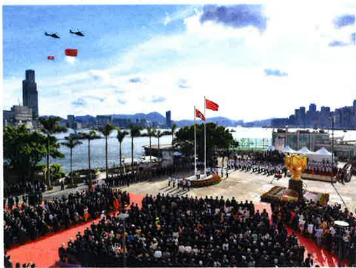
7月1日に行われた国歌斉唱と国旗・区旗掲揚の式典