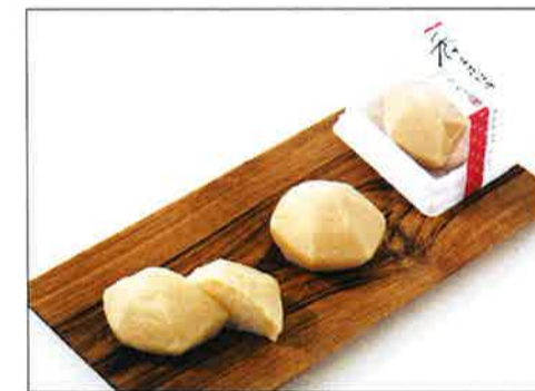
「香のおはぎ」りんご。他に抹茶、あずき、メロンがある