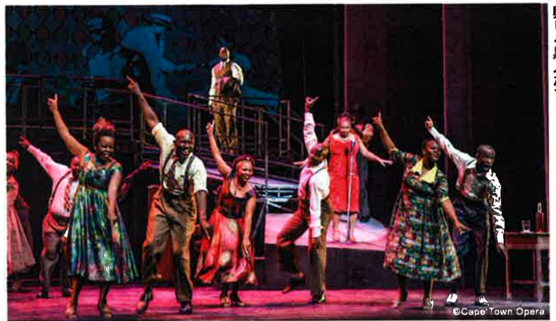
自由の街ソフィアタウンでタウンシップ・ジャズに興じる黒人たち