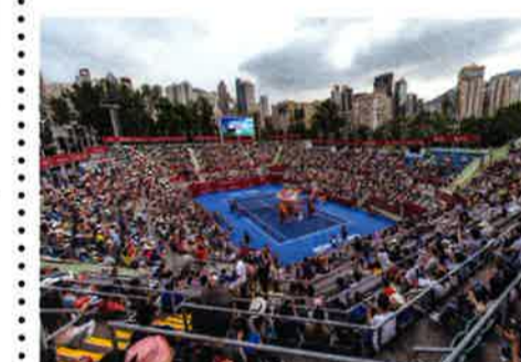
過去の大会のもよう

日によって異なる [所] ビクトリア公園テニススタジアム [料] $160~$880 (Cityline販売中) ※各種割引あり、7日・8日(予選)、9日(本選1回戦)は入場無料 [ウェブサイト] www.hktennisopen.hk