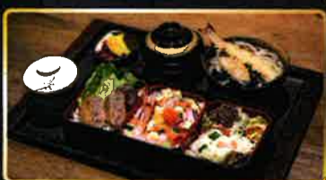
牛肉メンチカツ、ばらちらし片、ポテトサラダ、天婦羅うどん (月~金曜の日替わり定食)

磯焼きから刺身、釜飯、焼き物、串など、新鮮な食材を様々な調理法でご提供! 当店の新鮮な魚介類をぜひお試しください。お値打ちなランチも各種ご用意 店内は広々としたモダンジャパニーズスタイル。お友達との会食や宴会にぜひご利用ください。