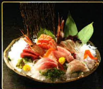
季節の刺し身盛り合わせ