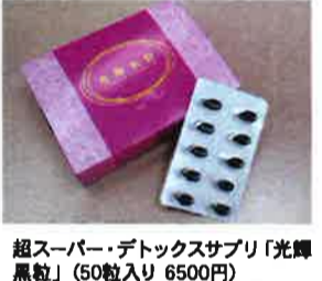
超スーパー・デトックスサプリ「光輝黒粒」(50粒入り 6500円) www.asian-cosme.asiaで発売中

私たちは日々忙しい毎日をご過ごしている年代です。気がついたら年老いていた両親、気がついたら年齢を重ねた自分のことを考えると「健康であり続けること」は、ありがたいことやと感じます。自分のためにできること、「光輝黒粒」を1日一粒飲むことから始めてみませんか?