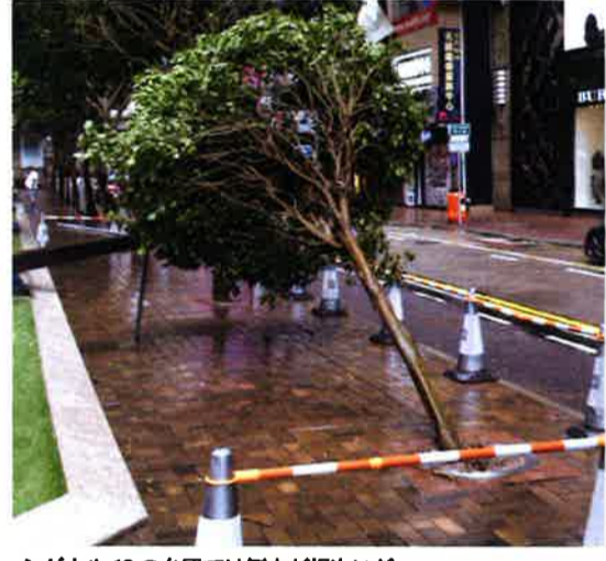
シグナル10の台風では倒木が相次いだ

先ごろ、大きな被害をもたらした台風13号（ハト）、台風14号（バカ）が相次いで香港に接近し、台風警報「シグナル8」や「シグナル10」が発令された。香港天文台の資料によると、今年にはこれまでに接近した台風に対し4つ連続でシグナル8が発令されたことになる。観測史上4つ連続でシグナル8が発令となったケースは、1948年以来2度目、69年ぶりだ。