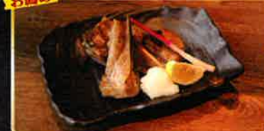
マグロのカマの塩焼き S128