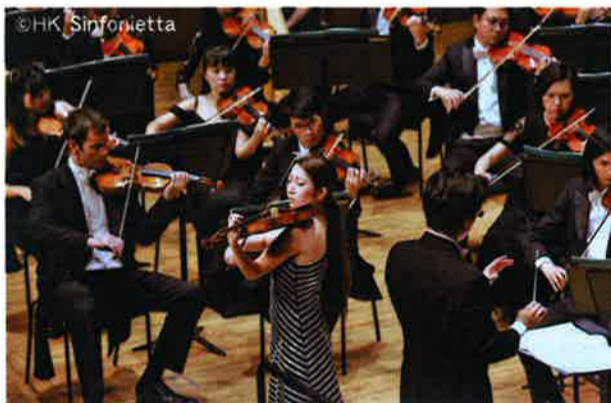
アルメニアの音と空気をバイオリンで奏でる

「アルメニアの人たちと数日間過ごしている間は、私自身を全部オープンにして吸収して帰りたい、と考えていました。滞在中に触れたさまざまな現地の生活や文化を通じて感じたのは、アルメニアの独特の音や空気でした。それは自分が知っていたものとは全く異なっていました。