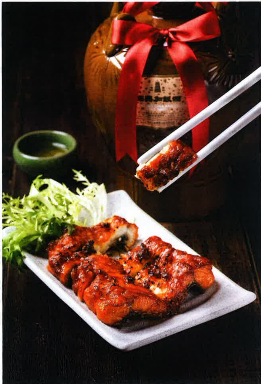
定番広東料理のひとつであるバーベキューポーク「金牌叉焼王」は店の力量が試される一品でもある。自家製ソースの深い味わいと絶妙な焼き加減がおいしさの秘訣だ