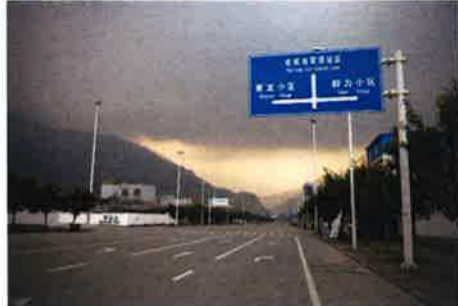
漢旺行きのバスの終点から少し歩いたところ。この先が「老城地震遺跡区」