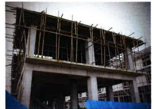
建設中と思われる建物