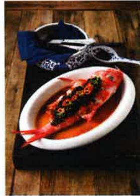
一尾丸ごと蒸した金目鯛をスパイシーな鼓椒でいただく「鼓椒蒸金目鯛」