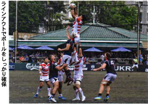
ライオンアウトでボールをしっかりと確保

2015年ラグビーワールドカップでのセンセーションを起こした日本代表だが、前節のホームでの香港戦では思わぬ苦戦を知られ、今回のアウェーでの戦いが注目を浴びた。開始直前に雨が降り出し、ボールも足元も滑りやすくなり精度が落ちた日本代表は思うようにゲームができな