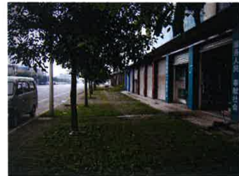
「境界」地域周辺の歩道