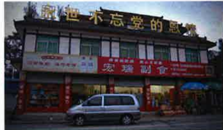
「永遠に党の恩情を忘れず」