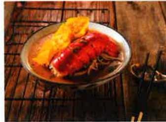
中華麺の上に豪快に盛り付けられたロブスターが印象的な「餃子龍蝦湯麵」は味も濃厚