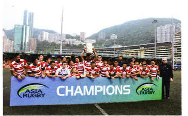
優勝を喜ぶ15人制ラグビー日本代表

い。前半はペナルティーゴール (PG) 1本だけ決め3対0というスコアで前半を終えた。