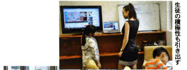
生徒の積極性も引き出す

受講料は1時間398ドル。初回は無料なので友人を誘って受講したり、子供同士で体験するのもいいだろう。