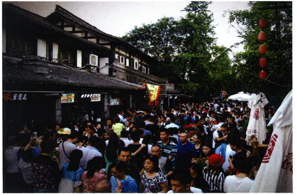
成都の寛窄巷子(かんさくこうし)は古い中国の町並みを再現した観光地だ