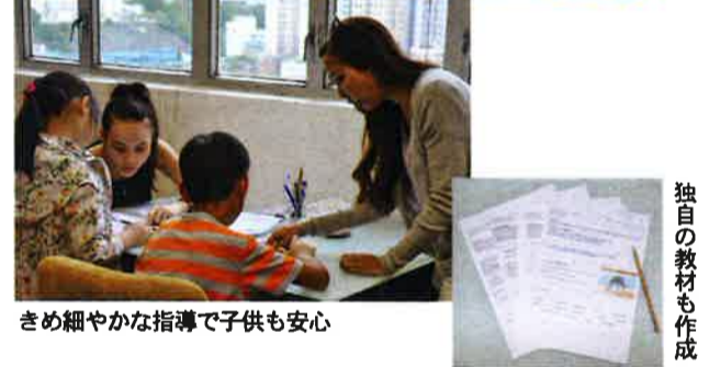
独自の教材も作成