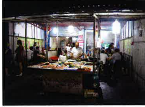
漢旺ではくし焼き屋が人気だった