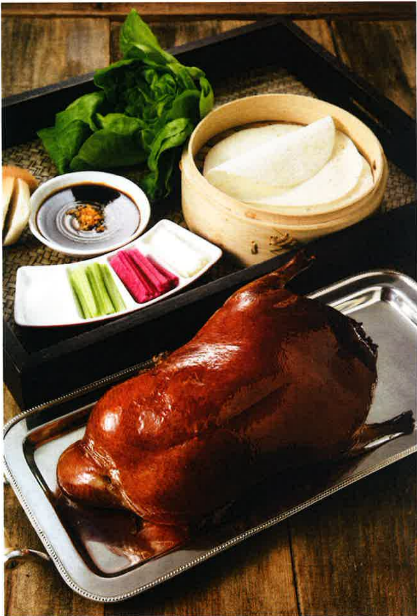
時間をかけてローストされた鴨のバリバリとした食感と、ガーリックを効かせた自家製ソースの奏でるハーモニーを楽しみたい「烤北京填鴨」はマストオーダーの一品

パソコン販売・修理 WEBサイト・ショッピングサイト構築 Email: info@kato-tech.com.hk HP: www.kato-tech.com.hk ☎2368 4673