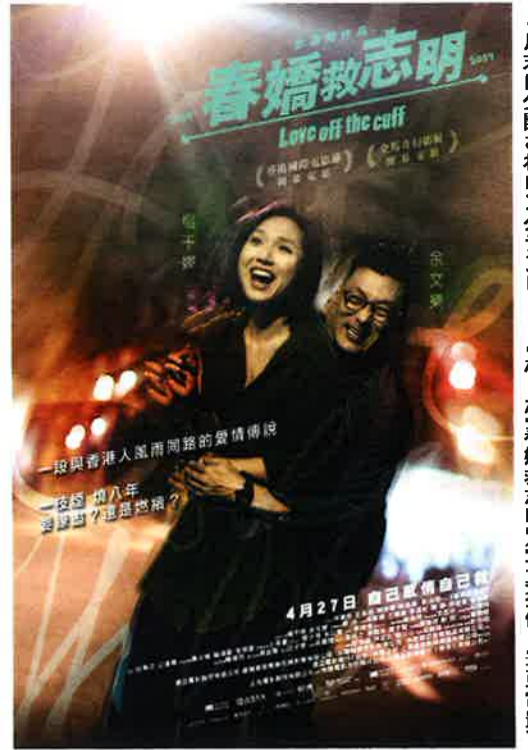
4月末に公開されロングランヒットとなった『春嬌救志明』

過去にさんざん「絶対に続編は撮らない」と公言していた監督だけに個人的に考えられないことだったが、前作がDVDなどで再評価され、人気作になったことも考えると、これもおいしいチャンス。しかも、続編の主な舞台は北京であり、別れた志明と春嬌の前に現れるのは本土の男女。つまり、しっかり中国市場も見据えていたのだが、劇中で徹底して描かれるのは本土人との思考や恋愛観のギャップ。つまり、これを笑いに変えることで、日ごろ、本土人とのギャップに頭を悩める香港の観客からの共感を得られるという狙いだった(ちなみに、『撒嬌女人最好命』では本土人と台湾人のギャップを描いている)。もちろんそれは的中し、前作の4倍以上となる2900万ドルの大ヒットを飛ばし、志明と春嬌のキャラは理想のカップルと呼ばれるよ