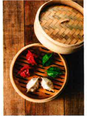
野菜で色付けた鮮やかな餃子は、あんも鴨肉、エビ、豚肉の3種類が楽しめる