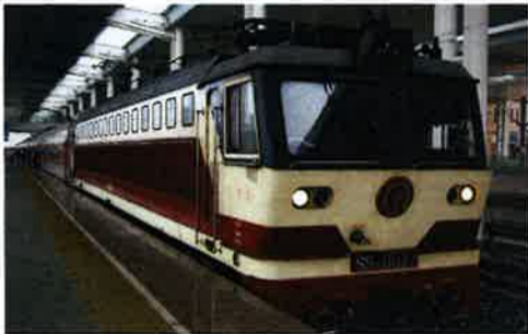
まずは成都駅から鉄道で徳陽へ向かった。距離にして61キロ、乗車時間は50分ぐらいだった

四川省は中国の内陸部にあり、山に囲まれた豊かな自然の中で、独自の文化を育んできた古い歴史を持つ地域です。近年、四川省は経済発展に伴い交通網が整備され、改めて「観光地」として注目を集めています。変貌する「蜀の国」を旅しながら、中国の今を探ってみました。(編集部)