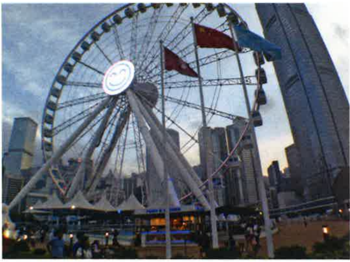
香港の今年通年のGDP伸び率は2~3%と予測されている