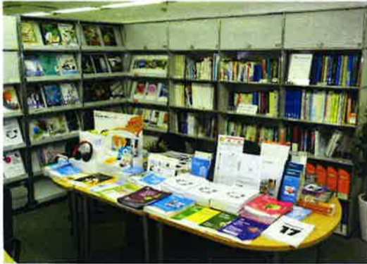
香港貿易発展局大阪事務所のライブラリー。営業時間(平日の9時から17時まで)なら一般の人でも利用可能...