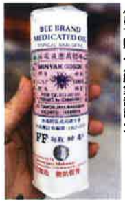
MINYAK GOSOKU ミンヤクゴソク 130.9gを特価85.00円で購入(編集部調べ)