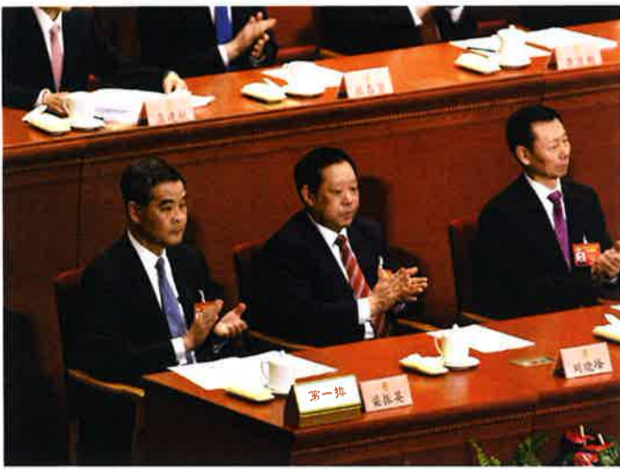
全国政協副主席に選出された梁振英・行政長官