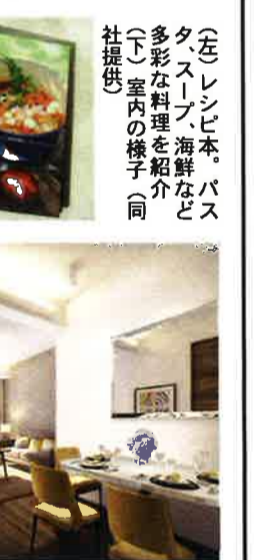
(左) レシピ本。バスタブ、スリッパ、海苔など多彩な料理を紹介。(下) 室内の様子

「快適に過ごさせる空間を追求」 Shama は中環、尖沙咀などにあるが、昔ながら滞在期間は6カ月から1年くらいが多かつたのですが、今は3カ月から6カ月ほどと短くなりました。家族連れがカプセルや単身者になるなど滞在者の構成も変わつてきています。1部屋あたりの予算も低くなりまし