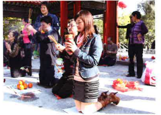
おみくじを振る音もにぎやかな本殿前

黄大仙祠には参拝だけでなく、運勢を占いに訪れる人も多い。本殿前で「求籤（竹籤）」