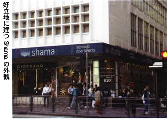
好立地に建つ Shama の外観