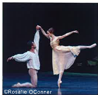
2月21~23日に公演を行う「アメリカン・バレエ・シアター」

シカゴ交響楽団など一部公演はチケットが早くも完売するなど反響を見せているが、ほかにも注目のプログラムがたくさんある。中でも香港ならではのカル