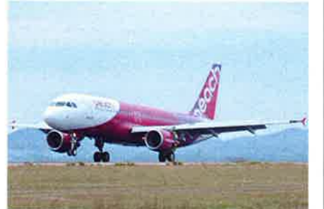
ビーチで使用されている航空機はすべてエアバスA320で、機種によって異なる操縦士や整備士のライセンスを単一機種に統一することで合理化を図っている。装備座席数は180席で、全席エコノミークラス。「高密度機材の高稼働」によって運航コストの大幅な削減を実現している

「LCCの業界には『VFR』（Visit Friends and Relatives）という言葉があります。『友人知人親族訪問』という意味なのですが、ビーチがLCCを通じて実現しようとしているのは、今まで飛行機を利用することがなかった人々に手軽に利用していただくことで、新しいマーケットを創出しようとしているのです。より多くの人々が飛行機を利用して、手軽に国境を越えて行き来できるようにすれば、もっと人々の交流や、文化の交流が促進される。国境を越えたフェース・トゥ・フェースの交流が深まれば、もっと未来志向の関係が構築されていきます」