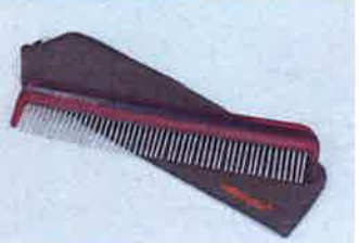
「クレンジングコム」(アジアコスメオンライン価格3800円)

ところで、足の裏に体全体の反射区があるように、頭にもたくさんのツボが集まっています。そこをきちんと適切な方法で毎日刺激することにより、頭皮頭髮の悩みだけでなく、体全体に働きかけて、いつも健康な状態を保てます。