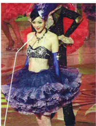
2006年度のミスアジア（アジア小姐）は10月29日晚、マカオコタイ地区にある澳門蛋（マカオドーム）で開催された

香港三大ミスコンの一つミスアジア（アジア小姐、ATV）は例年だとミス香港（香港小姐、TVB）終了後に立ちあがり、10月末に総決選となるが、2011年度は12月開催となり、12年度は12月の大中華総決選を最後に、とうとう正月をまたいだ。例年秋に開催されるミスチャイニーズコスモス（中華小姐環球大賽、鳳凰衛視）とのパッシングを避けたのだろうか