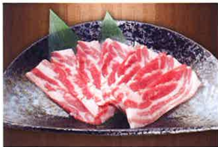
甘くコクのある日本産黒豚バラも人気の一品。「日本産黒豚バラ」(78ドル)