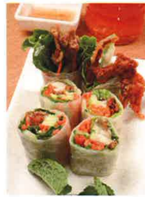
アボカドとソフトシェルクラブが入った「越式米紙巻配軟殼蟹」(65ドル)