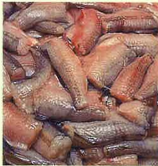
九肚魚(ウナギ科の魚)