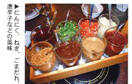
唐辛子などの薬味、にんにく、ねぎ、ごまだれ

■正斗海鮮火鍋店 所在地：G/F., Hing Wha Commercial Bldg., 450-454 Shanghai Street, Kowloon 電話：2771-5711