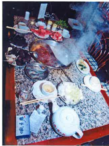
大勢集まればたくさん種類の具材が楽しめる

食べ方はスープが沸騰したら好みの具を入れる。牛肉などは各自が穴開きのお玉に入れ、しゃぶしゃぶと同じ要領で火を通して食べる。イカボールやギョーザ、内臓類は煮えているかどうか確認してから食べよう。