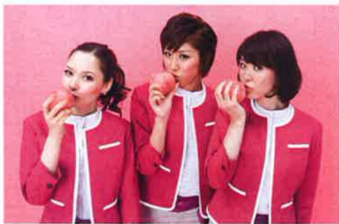
ビーチではローコストの追求から、客室乗務員の制服の必要性の是非すら検討の対象となった。その結果として、制服は採用されたが、一般的なえりのあるスーツではなく、スカーフは首ではなく腰に巻くことで、親しみやすさがかわいらしいビーチのブランドイメージを写真もモデルのとなさく公算された。このような広報用の写真もモデルから広く公募された。このように広報用の写真もモデルから広く公募された。このように広報用の写真もモデルから広く公募された。このように広報用の写真もモデルから広く公募された。

「LCCの業界には『VFR』（Visit Friends and Relatives）という言葉があります。『友人知人親族訪問』という意味なのですが、ビーチがLCCを通じて実現しようとしているのは、今まで飛行機を利用することがなかった人々に手軽に利用していただくことで、新しいマーケットを創出しようとしているのです。より多くの人々が飛行機を利用して、手軽に国境を越えて行き来できるようにすれば、もっと人々の交流や、文化の交流が促進される。国境を越えたフェース・トゥ・フェースの交流が深まれば、もっと未来志向の関係が構築されていきます」