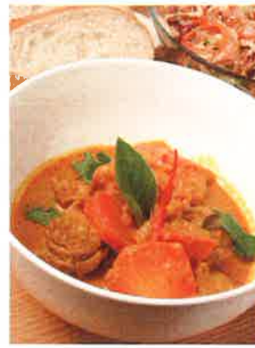
バゲットといただくカレー「咖喱雞肉配麵包」(72ドル)。ハーブの香りが立ちこめる