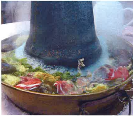
スープはあくまであっさり、具の持ち味を生かす

具は肉類、きのこ、野菜、豆腐、ゆば、ギョーザ、肉団子などさまざまだが、やはり北京スタイルに羊肉は欠かせない。羊肉はたんぱく質、鉄分、カルシウムを豊富に含むため体を温め、冷え性や貧血に効果的といわれている。まさに寒い季節にはぴったりだ。