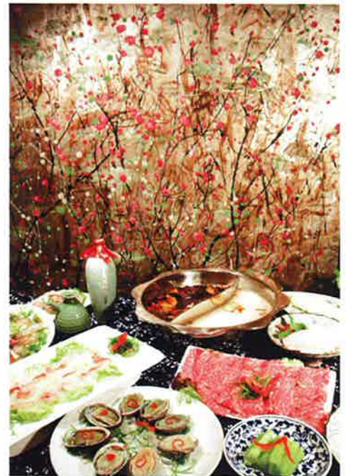
四川省ならではの具材もそろっている。お得なセットメニューはうれしい2人用から

■合江小鎮 所在地：1/F., Cosmopolitan Hotel Hong Kong, 387-397 Queen's Road East, Hong Kong 電話：3167-7833