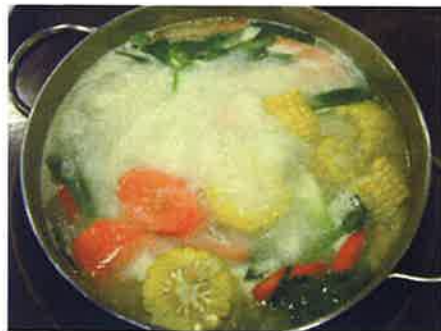
店員お薦めのスープの1つ「正斗豚骨鍋」