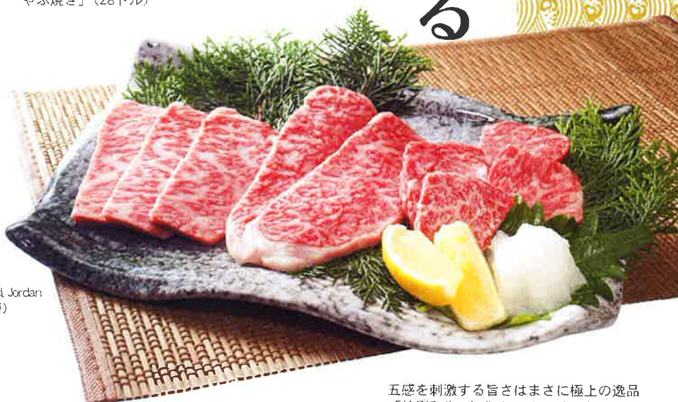
五感を刺激する旨さはまさに極上の逸品「特選和牛3点盛り」(298ドル)