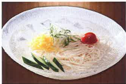
焼肉の後はサッパリと締めで。年中食べられる「冷やしそうめん」(38ドル)