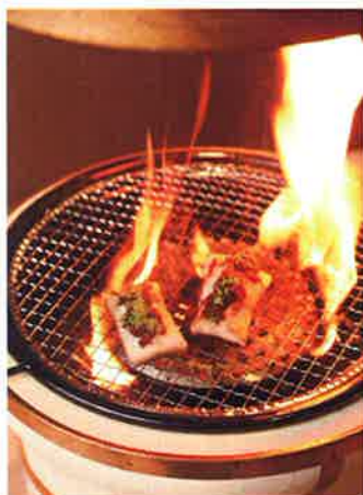
薄切餅の上には小豆や抹茶をお好みで。女性に人気のデザート「もちしやぶ焼き」(28ドル)