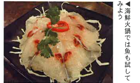
みょう 海鮮火鍋では魚も試してみよう

鍋の最後はめんやごはんでしめたい。うどんもいいが、ラーメン好きの香港人にならって公仔麵（インスタント麺）を注文するのが通。また店内に設けられた水槽には新鮮な魚介類が並んでおり、火鍋と共に刺し身など海鮮料理も注文できる。