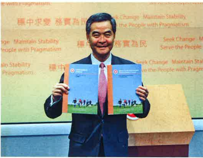
施政報告の発表後に記者会見を行った梁振英・行政長官