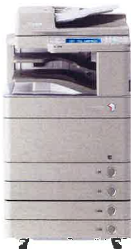
写真はimageRUNNER ADVANCE C5200の外観

外観はimageRUNNER ADVANCE C5000と大きな違いはないが、機能面では大きな改善がみられた。