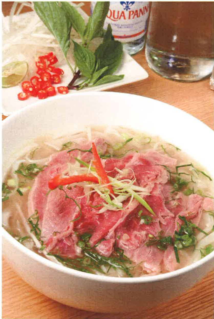
看板メニューのスープのフォー「越南湯河配牛肉」(55ドル)。一口スープをすすれば、凝縮したうま味が口の中に広がる。ほかに鶏肉、ベトナムハム、野菜から選べる