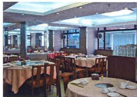
広い店内は長い歴史と風格を感じさせる

■泰豊楼 所在地：29-31 Chatham Road, Windsor Mansion, Tsim Sha Tsui, Kowloon 電話：2366-2494