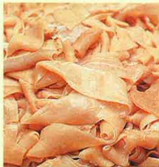
生腸(ガチョウの腸)