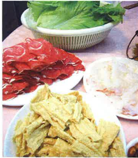
羊肉は寒い冬に体を暖めるのに最適