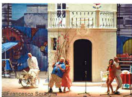
イタリアの「サン・カルロ劇場」によるオペラ『Il Marito Desperato』