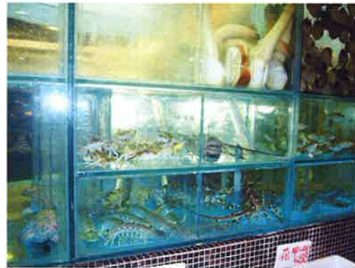
店内に設置された大きい水槽にはエビ、貝、シャコなど新鮮魚介がいっぱい

スープは四川麻辣鍋（四川風の辛いスープ）、香茜皮蛋鍋（香草とピータンのスープ）、羅宋鮮茄蟹仔豚骨鍋（トマトとじゃがいも入り豚骨スープ）、海鮮蟹鍋、正斗魚湯鍋など、肉ベースから魚ベースまで取りそろえている。中でもお薦めスープの1つ「正斗豚骨鍋」は、豚骨を使ってじっくりだしを取ったし